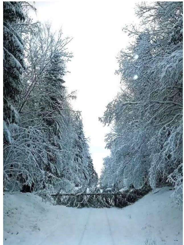
Vid Brokind julafton 2023.

ställer, som sagt, idag till med stora bekymmer på Stångådalsbanan och andra inte trädsäkrade järnvägslinjer i vårt land.