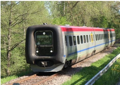
Y2 in Kisa im Mai 2024

Die Personenzüge werden von Dieseltriebwagen der Baureihe Y2 , Jahrgang 1996 und 1997, mit den Nummern 1379-1384, und Y31 , Jahrgang 2010 gefahren. Diese werden bis Jahr 2027 mit neuen Zweikraft-Fahrzeugen der Baureihe BIR1 ersetzt, d.h. sie bekommen ihre Stromversorgung entweder über die Oberleitung oder nutzen HVO/Diesel.