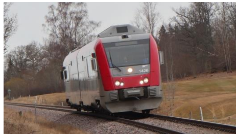
Y31 bei Slattefors im April 2022

Das Bahnbetriebswerk in Kisa wurde 1901-1902 von ÖCJ gebaut und ist ein einständiger Lokschuppen. Es wurde hauptsächlich für übernacht-stehende Dampflokomotiven benutzt. ÖCJ's Werkstatt befand sich in Linköping.