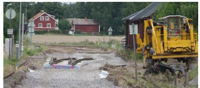
En av de aktuella växlarna i Hjulsbro, i all sin ensamhet vid spårbytet 2013.